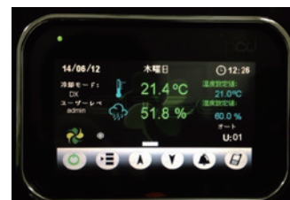
制御表示パネル (タッチスクリーン)